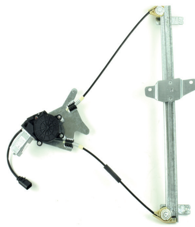
Our window regulator - notre lève-vitre - unser Fensterheber - nuestro elevalunas- nosso levantator de vidro - Γρύλος γνήσιος - nostro alzacrystallo